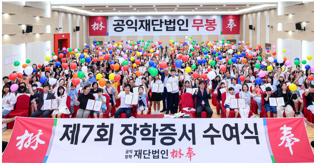
공익장학재단 무봉장학생 장학증서 수여식

무봉재단을 통해 매년 수백 명의 어린이들을 후원하며, 실질적인 나눔을 이어가고 있습니다.