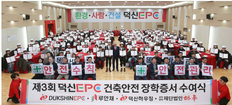
제3회 덕신EPC 건축안전 장학증서 수여식

최근 우리 사회 전반에 걸쳐 안전한 대한민국을 만들기 위한 다양한 노력이 활발히 진행되고 있습니다. 이에 발맞춰 당사도 생산시설 및 작업환경에 대한 철저한 안전점검을 시행하고, 공사 현장에서는 안전사고 예방을 위한 조치를 강화하며 안전 중심의 경영을 실천하고 있습니다.