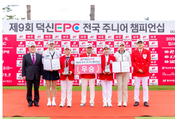
전국 주니어 챔피언십 골프대회

이밖에도 덕신EPC 골프장학생 후원, 덕신EPC배 전국 주니어 골프대회 개최, 백두산 역사탐방, 독도사랑 광복음악회, 상해 역사문화 탐방, 실종아 동 찾기 캠페인 등을 통해 끊임없는 사회공헌 사업을 진행하고 있습니다.