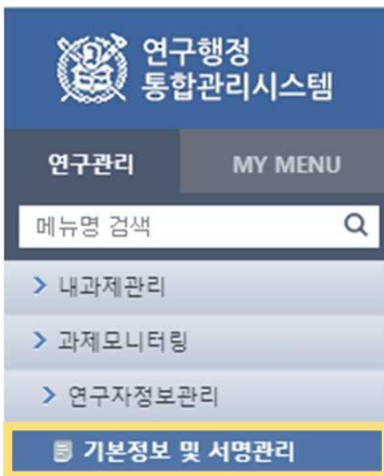
Basic information and signature management Signature registration