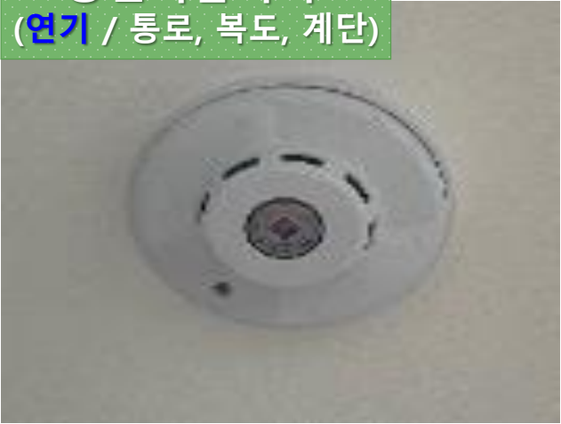
광전식감지기 (연기 / 통로, 복도, 계단)