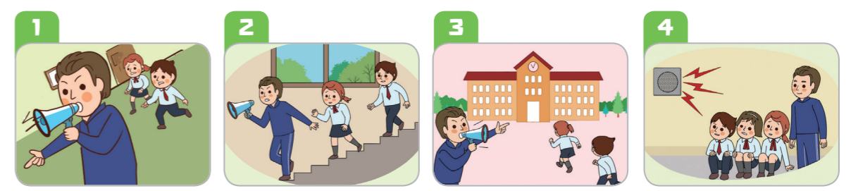
1 선생님과 함께 정해진 대피 장소로 이동해요. 2 계단을 이용하고, 밀거나 뛰지 않아요. (엘리베이터 이용 금지) 3 운동장 등 실외활동 시 실내 또는 지정된 대피 장소로 이동해요. 4 대피 장소에 머물며 침착하게 행동하고, 재난 방송을 들어요.