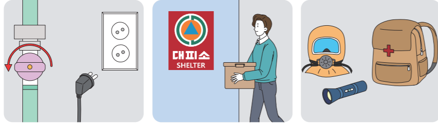
가스 차단, 전기코드 분리 비상용품 대피소로 이동 개인보호장비 정비