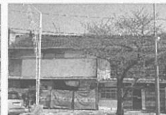
4 진해 화천동 근대상가주택