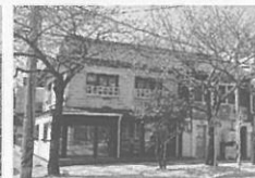
5 진해 송학동 근대상가주택