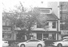
8 진해 흑백다방