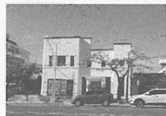
3 진해 보태가