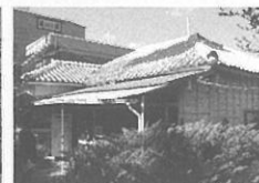
10 진해 진해해군통제부 병원장 사택