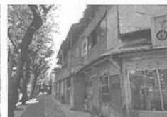
9 진해 창선동 근대상가주택