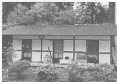
2 진해 구 태백여인숙