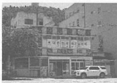
7 진해 일광세탁