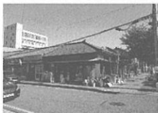
6 진해 대흥동 근대상가주택