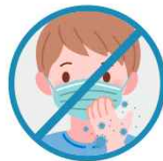
착용중 마스크 만지지 않기 만진 후 깨끗이 손씻기