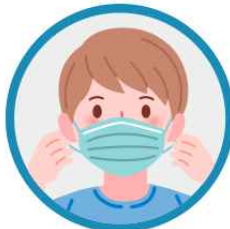
입과 코를 가리고, 틈이 없도록 착용