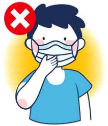
걸을 만지는 행위