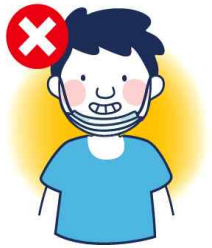
턱에 걸치는 착용