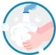
마스크 착용 전 깨끗이 손 씻기