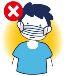
코만 가리는 착용