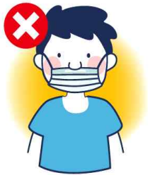
입만 가리는 착용