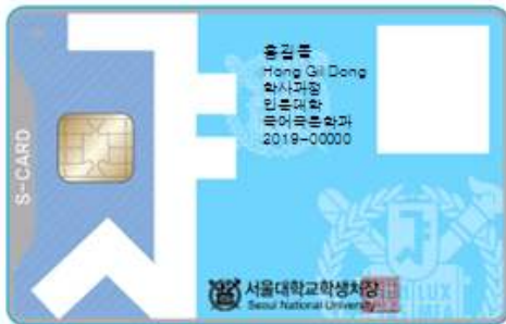
< 앞 면 >