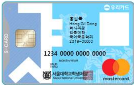
< 앞 면 >