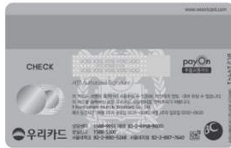
< 뒷 면 >