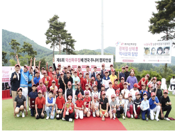
전국남녀 주니어 골프대회