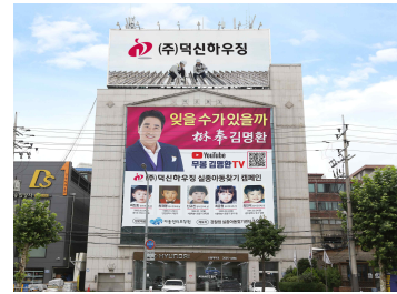
무봉TV 유튜브 채널